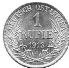
1 rupie (zilver) 1913J, keizer Wilhelm II, Deutsch Ostafrika