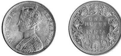
1 rupie (zilver) 1898, keizerin Victoria, Brits India

Oost-Afrika is een gebied dat veel te danken heeft aan zijn strategische ligging; het kruispunt van de Afrikaanse, Arabische-Indische en Europese handelaars was nog niet zo lang geleden het tweede vaderland van de Indische rupie 1/. Deze zeer succesvolle munteenheid werd 500 jaar geleden geïntroduceerd en is nog steeds de munteenheid van een aantal landen rond de Indische oceaan 2/. Zijn invloedssfeer reikte tot in het vroegere Duits Oost-Afrika en Brits Oost-Afrika, zijnde nu Tanzania, Kenia, Oeganda, Somalië, Rwanda en Burundi. De geschiedenis van Duits Oost-Afrika is kort maar intens en startte in 1884.