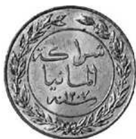
1 pesa (koper) 1890, Deutsch-Ostafrikanische Gesellschaft