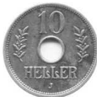
10 heller (kopernikkel) 1909J, Deutsch Ostafrika