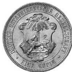
1 rupie (zilver) 1890, keizer Wilhelm II, Deutsch-Ostafrikanische Gesellschaft

In hetzelfde jaar werd de “Deutsche Ostafrikanische Gesellschaft” overgenomen door het “Auswärtige Amt” (ministerie van Buitenlandse Zaken) en vanaf dit moment werd de rupie verdeeld in 100 heller. De munten werden geslagen in Berlijn en Hamburg met de respectievelijke muntmerken A en J.