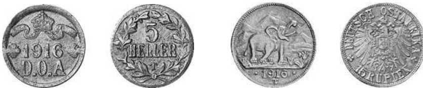
5 heller (messing) 1916T, D.O.A. 15 rupien (goud) 1916T, Deutsch Ostafrika

Er werd overgegaan tot het slaan van messing/bronzen en gouden munten en het drukken van papiergeld inruilbaar tegen wettelijk betaalmiddel na de oorlog. De stempels werden vervaardigd in het atelier van de spoorweg van Kilimatinde, volgens de tekeningen van een jonge spoorwegtechnicien. Munten van messing/brons of koper van 5 en 20 heller en gouden 15 rupienstukken werden geslagen met muntmerk T (Tabora) en de afkorting DOA of Deutsch Ostafrika in 1916. Het metaal was afkomstig van de spoorwegateliers of van de gebruikte kogelhulzen en granaten. De gouden munt werd ter beloning gegeven aan elke soldaat die een vijand kon neerhalen. De 15 rupie was ongeveer 20 mark of 1 sovereign waard, maar met het lage goudpercentage 750/1000 had het maar een reële waarde van 15 mark. 16.000 munten werden geslagen met de beruchte olifant en de Kilimanjaro op de achtergrond. Het goud was afkomstig van de goudreserves van de Kirondamijn Senkenke (noordoosten van Tabora) en van de Kasamamijn (zuidoosten van Nasa bij het Tanganikameer). Hogere coupures werden gedrukt op lokaal krantenpapier van verschillende kleuren.