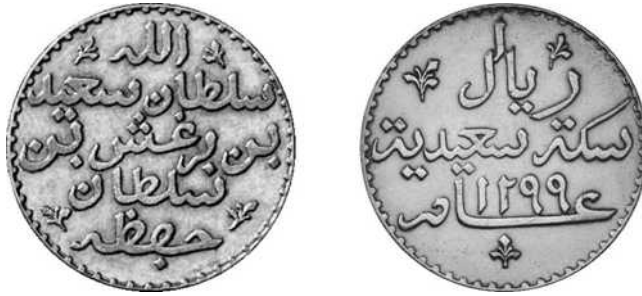
1 ryal (zilver) AH1299, Zanzibar

zilverprijs en oorsprong (Zanzibar, Oman, Aden etc.). Bovendien werden de pysas van Arabische oorsprong (Oman, Aden etc.) soms tot de helft van de prijs verhandeld ten opzichte van de Indische pysas. 1 pysa AH1299 (1881) en AH1304 (1886), \frac{1}{4} ryal AH1299, \frac{1}{2} ryal AH1299, 1 ryal AH1299, 2 \frac{1}{2} ryal AH1299 en 5 ryal AH1299 van Zanzibar \frac{7}{8} werden geslagen maar sommige zijn zeer zeldzaam. De pysa was gelijk aan de Indische \frac{1}{4} anna. Daarnaast waren er ook sommige Indische rupies \frac{8}{16} met een overdruk van het eiland Pemba in omloop.